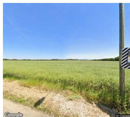
Vue STREET VIEW du secteur